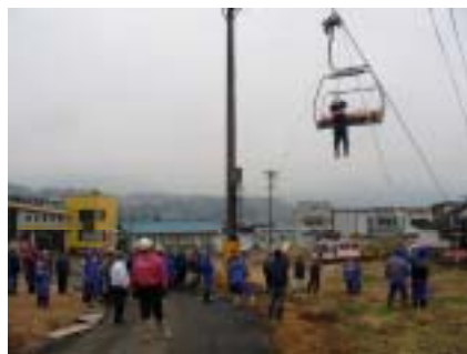
救助ポールによる救助訓練