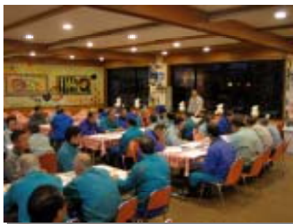
外部講師による技術講習会