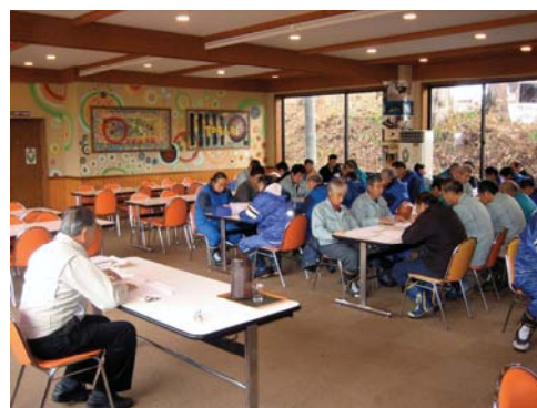
シーズン前技術講習会