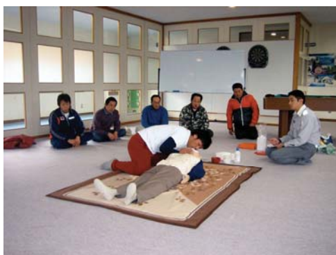
シーズン前救命講習会