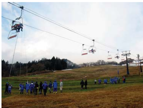
シーズン前救助訓練