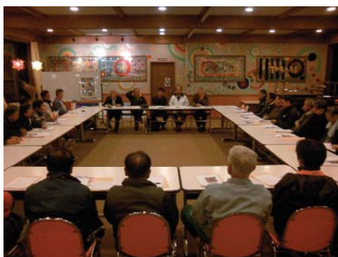
シーズン前正副主任会議