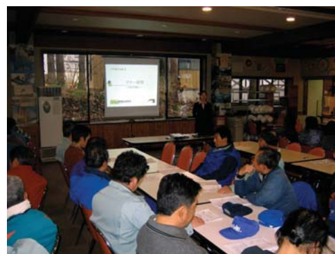
シーズン前マナー講習会