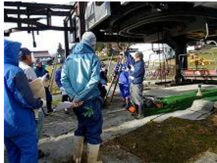
救助用具取扱い説明