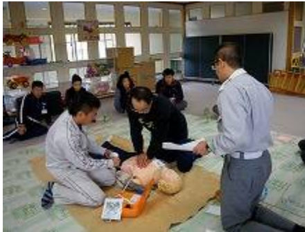
救急講習会（AED取扱い 心肺蘇生法）